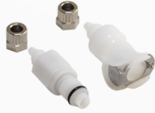
Pnömatik Hortum Uyumlu Konnektör Seti