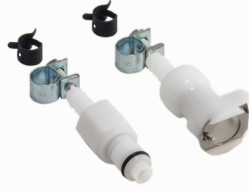
Silikon Hortum Uyumlu Konnektör Seti