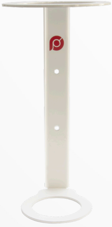
Saflaştırıcı Filtre Tutucu

GLF-30 Gaz Hatları için Saflaştırıcı Filtre dişi ve erkek bağlantıları ile kolayca sökölüp takılabilir. Her tip gaz hattında kullanımı için konnektör setleri mevcut olup, tasarımı özel olarak yapılan filtre tutucu sayesinde güvenli kullanım sağlar.